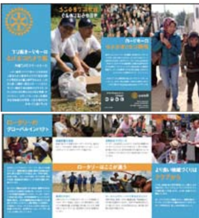
会員候補者向け資料:自分のできる事 今日から始めよう (資料番号:001)

ロータリーとは何かを説明するには写真にある3つのフレーズを使うと一貫性があり、明確に表現できます。様々な「リーダーが集まり」「アイディアを広げ」社会のために「行動する」