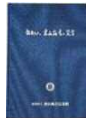
B5判 記念館35周年記念誌 本文268ページ/2,500円