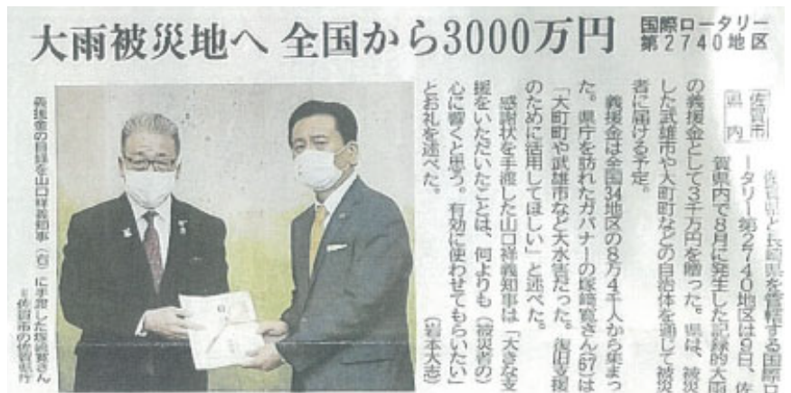
佐賀新聞：2021年11月12日掲載