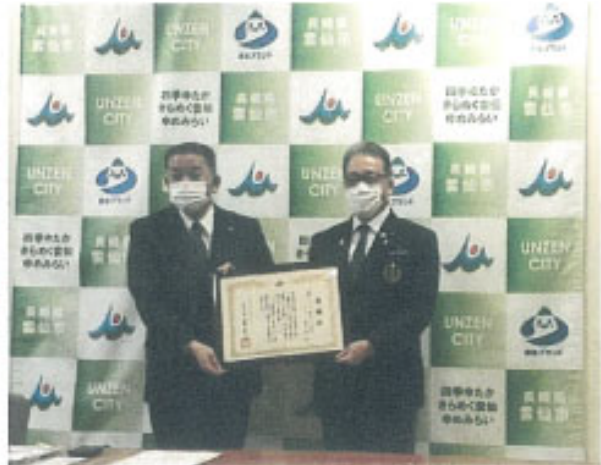
長崎新聞：2021年11月12日掲載

「ロータリークラブの」ネットワークを利用した活動に感謝する。創造的な観光復興に活用したい」と述べた。 この災害で、同市を窓口として寄せられた義援金などは今回を含め計86件、総額約1700万円になった。(宮崎 昭明)