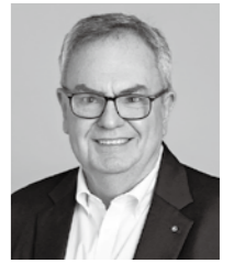
2023-24年度 国際ロータリー会長 ゴードン R. マッキナリー Jennifer E. Jones

South Queensferryロータリークラブ所属 スコットランド(ウェストロージアン)